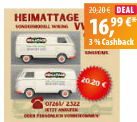
Wiking VW Bully Heimattage