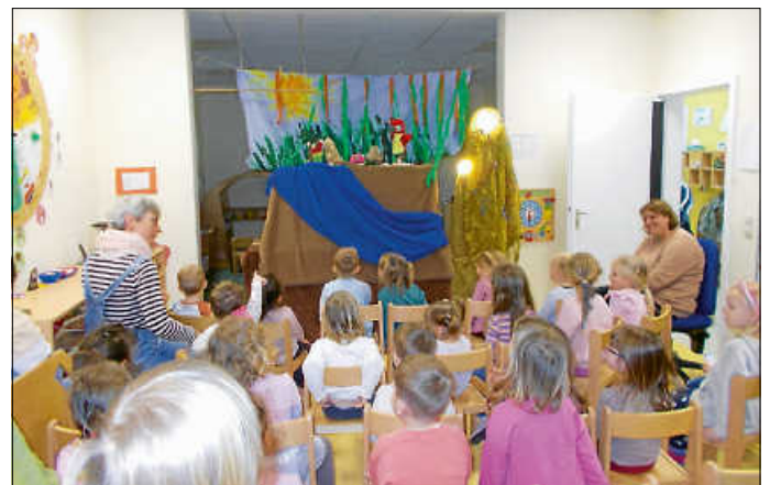
Theateraufführung im Kindergarten GROMOHAUS

Unter dem Titel „ Bruno und Toni – Freundschaft über den Fluss hinaus “ erlebten die Kinder eine spannende Geschichte rund um Mut, Zusammenhalt und echte Freundschaft.