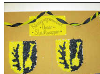
Stadtswappen mit Knülltechnik

„Ich und mein Umfeld“ ist das Jahresthema der Sternchengruppe. Wir fingen mit den Unterthemen „Ich“ und „meine Familie“ an. Jetzt sind wir bei „meine Umgebung“ gelandet. Als Erstes gestalteten wir unseren Stadtplan, der nun in unserem Malzimmer hängt.