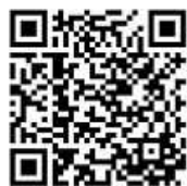
Terminvergabe Stadtkasse/SW Ori

Telefonzentrale: 07042 909-0 Bürgeramt: 07042 909-36 Vorzimmer des BM 07042 909-20