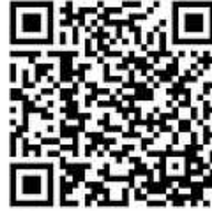
Terminvergabe Stadtkasse/SW Ori

Telefonzentrale: 07042 909-0 Bürgeramt: 07042 909-36 Vorzimmer des BM 07042 909-20 (weitere Durchwahlnummern finden Sie auf unserer Homepage unter www.oberriexingen.de/rathaus-politik/stadtverwaltung/ansprechpartner/ oder mittels des folgenden QR-Codes) E-Mail: rathaus@oberriexingen.de Bürgeramt: buergeram@oberriexingen.de