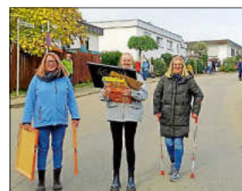
Schwer bepackt mit Fundstücken.