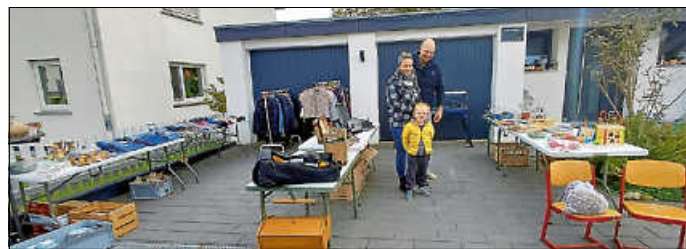
Familie Hegedusch hat im Vorfeld kräftig ausgemistet.