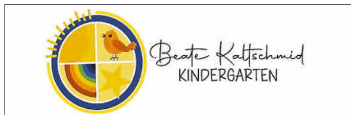
Unser Logo wurde von Bianca Frech entworfen

Im Rahmen des Veränderungsprozesses sind neue Logos entstanden, die wir hier vorstellen möchten.