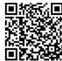
Terminvergabe Stadtkasse/SW Ori

Telefonzentrale: 07042 909-0 Bürgeramt: 07042 909-36 Vorzimmer des BM 07042 909-20 (weitere Durchwahlnummern finden Sie auf unserer Homepage unter www. oberriexingen.de/rathaus-politik/ stadtverwaltung/ansprechpartner/ oder mittels des folgenden QR-Codes)