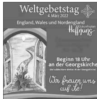
Plakat: Grafikquelle: Melanie Seemüller // WGT

uns wichtig. Die Weltgebetstag-Frauen aus England, Wales und Nordirland machen Mut Gott zu vertrauen. Sie stellen den Weltgebetstag 2022 unter das Motto: „Zukunftsplan: Hoffnung.“ Im Vorbereitungsteam hatten wir einen erfrischend-kreativen Abend. Dabei ist ein besonderer Weltgebetstag für Oberriexingen entstanden: