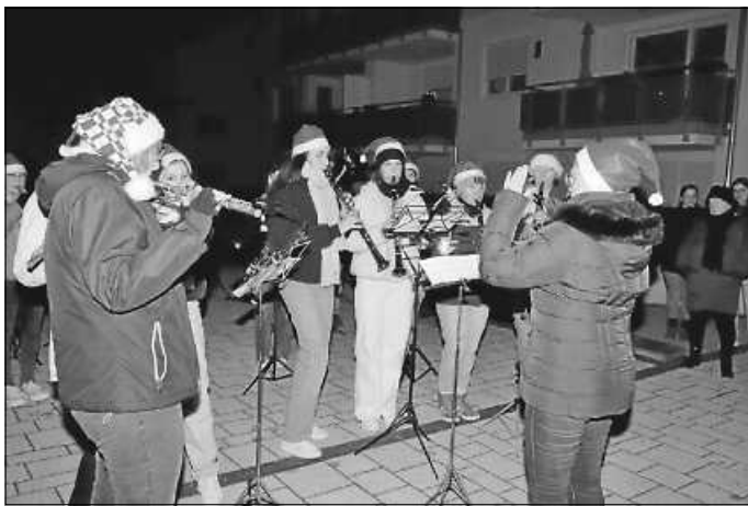
Die Stadtkapelle sorgte auch für musikalischen Genuss.