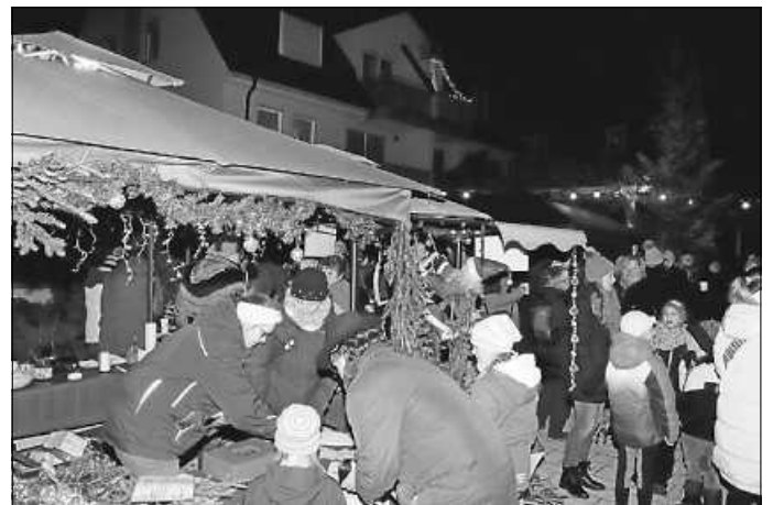
Besucher jeden Alters genossen das Zusammentreffen vor den Advents-Hüttlen.

Da in diesem Jahr aufgrund allerlei Ukraine-Möbelspenden die Kelter für den traditionellen Adventsmarkt am 25. November nicht zur Verfügung stand, öffneten die Hüttlen vor dem Betreten Wohnen schon zu diesem Zeitpunkt ihre Fenster. Wie Susanne Griebel und Kathrin Hüeber vom Bürgeramt berichteten, sei die bisherige Resonanz sehr gut. Zum Auftakt wurde mit Krämers Kit sogar eine Live-Band engagiert, die Klassiker zum Mitsingen, aber auch besinnlichere Klänge zum Besten gab. Die Bewirtung durch das Jugendhaus mit regionalen Produkten, duftenden Waffeln der Erstklässler sowie die legendäre Feuerzangenbowle des Gemeinderates, haben dabei reißenden Absatz gefunden, so die beiden Organisatorinnen. Auch am zweiten Adventsfreitag hielt selbst Nieselregen viele Oberriexinger nicht davon ab, bei den festlich geschmückten und beleuchteten Holzhäuschen des TSV, den Drittklässlern und des Elternbeirats des Kindergartens vorbeizuschauen und regen Gebrauch von der traditionellen Nikolausaktion zu machen. Auch hier seien Glühweinkessel und Grill schon vor dem offiziellen Ende leer gewesen, hörte man weiter.