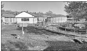
Bauliche und technische Veränderungen an der Kläranlage in Oberriexingen

Die Stadtwerke Bietigheim-Bissingen werden die Ausschreibung der Gesamtbaumaßnahme gemeinsam mit ähnlichen Vorhaben in Freudental und Walheim vornehmen, um Synergieeffekte zu erzielen. Das entsprechende Baugesuch für die Umbauarbeiten sollen die Oberriexinger Gemeinderäte in ihrer nächsten Sitzung am 24. November dieses Jahres beschließen. Die Tiefbauarbeiten werden noch im Dezember beginnen, und ab März 2021 wird die neue Anlagentechnik installiert werden. Die Fertigstellung des Vorhabens ist für Anfang Oktober 2021 geplant. Bis 2029 müssen in der Kläranlage Bietigheim-Bissingen aus dem Klärschlamm die Phosphorwerte recycelt und wieder zurückgewonnen werden. Aktuell gibt es dafür zwar mehrere Politprojekte, aber noch kein wirtschaftliches Verfahren, wie Experte Ruf von den Stadtwerken Bietigheim-Bissingen den Gemeinderäten mitteilte.